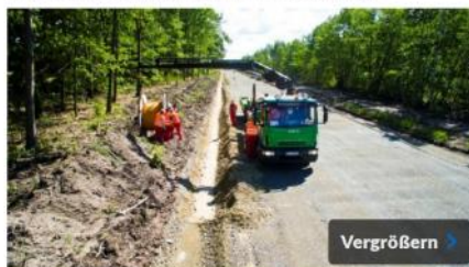
Um die ländlichen Ortstelle der Stadt Lauchhammer zu erschließen, sind über viele Kilometer Glasfaserkabel verlegt worden.