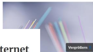
Ich die dörflchen Ortstelle der Stadt Lauchhammer im Datennetz.